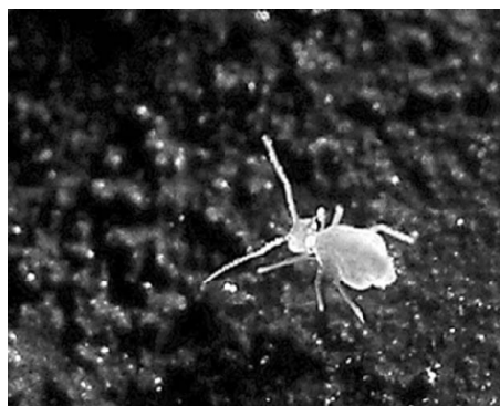
Obr. 2. Chvostoskok Arrhopalites aggtelekiensis .

Dva zo zistených druhov ( Ceratoppia bipilis a Xenillus tegeocranus ) sa našli v srsti drobných zemných cicavcov (Miko, 1990; Miko – Stanko, 1991). Väčšina druhov panciernikov bola zistená v časti so zvyškami starého dreva blízko vchodu. Je pravdepodobné, že sem niektoré mohli byť donesené už s drevom. V jaskyni sme zachytili 6 druhov dravých roztočov skupiny Gamasina. Dominantnou a frekventovanou bola Paragaramania dentritica , troglobilná forma, pôdny druh. Známe sú aj nálezy z jaskýň (Demänovská jaskyňa mieru, viacero jaskýň Slovenského krasu). Vulgarogamasus remberti bol druhým najpočetnejším druhom v jaskyni. Na Slovensku je to bežný jaskynný druh, aj v zaľadnených jaskyniach, konkrétne v Ľadovej pivnici (Fend'a – Košel, 2004) a v jaskyni Duča (Fend'a – Košel, 2000). Cyrtolaelaps mucronatus , Proctolaelaps