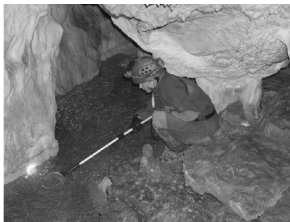
Obr. 1. Zber fauny z jazierka v Kvapľovej sieni. Fig. 1. Hand collecting of fauna from a water pool in Kvapľová Hall.

Dno väčšiny jazier je pokryté alochtónnymi fluviálnymi sedimentmi (štrky, piesky), ktoré v minulosti naplavil do podzemných priestorov tok paleo-Hnilca, ďalej rôznymi úlomkami hornín, vápenca, sintra a vrchnou vrstvičkou hlinitých usadenín (Novotný – Tulis, 2002). V obmedzenom rozsahu sú vo vode prítomné organogénne sedimenty (roztrúsený trus a miestami aj uhynuté telá netopierov v rôznom štádiu rozkladu, fragmenty tiel bezstavovcov). V recentnom období sú všetky vodné telesá v jaskyni vyživované presakujúcimi atmosférickými vodami z povrchu. Autochtónne vodné toky sa nezistili. Výška hladiny jazier v priebehu roka značne kolíše v závislosti od hydrologických podmienok na povrchu, podmieňujúcich intenzitu priesakových vôd infiltrujúcich do týchto jazier cez tektonické zlomy a pukliny v nadloží (Novotný – Tulis, 2002). Tento jav sme pozorovali počas októbrovej návštevy jaskyne, keď v porovnaní s aprílovým stavom nastal výraznejší