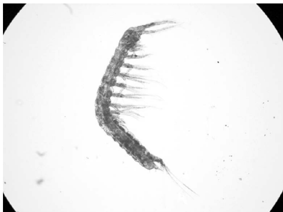
Obr. 3. Hľbinovka slepá Bathynella natans .

Najpočetnejšiu skupinu odchytených živočíchov tvoria chvostoskoky, terestrické článkonožce, ktoré sú schopné využívať vodnú hladinu ako mikrohabitat. Najcennejší spomedzi nich je nález jedného jedinca z rodu Megalothorax v Severnej chodbe; predstavuje pravdepodobne nový druh pre vedu. Podobná jaskynná forma bola zaregistrovaná v Bystrianskej jaskyni (Mock et al., 2003). Nemenej zaujímavý je výskyt jaskynných druhov