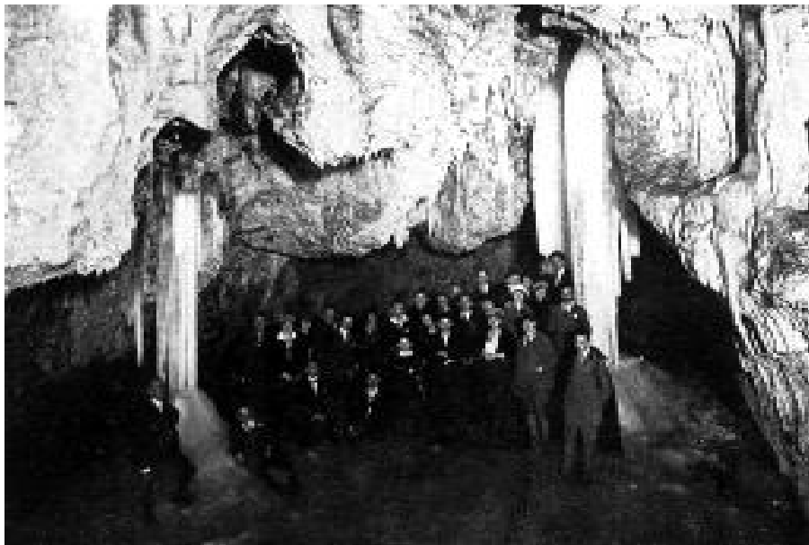
Skupina návštevníkov v Kmeťovom dóme.