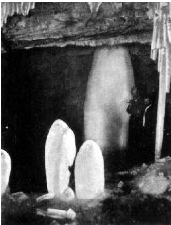
Vstup do Kmetovho dómu.

Niekoľko krokov ďalej nachádzame divo rozoklanú rozsadlinu, kde voda tiež mizne pod zemou. Strašná to hĺbka, o čom sa možno presvedčiť hodením kameňa do vody, ktorá dlhý čas buble, kým kameň dosiahne dno. Vedie cez ňu lávka do ďalších dier jaskyne. Tu sme však zastali, zrejme vplyvom silného prítoku vody bola lávka strhnúť, takže sa nedalo prepraviť na druhú stranu. Lutovali sme, že naše putovanie po jaskyni sa skončilo v týchto miestach. Skutočne veľká škoda, ak usudzujeme podľa toho, čo sme videli na začiatku jaskyne. Ktovie ešte aké divy na nás čakali pri ďalšom putovaní v útrobach jaskyne. Ako sa nedá veriť opisom, ale všetko si treba dôkladne preveriť osobne na mieste. Szepesházy hovorí 5 , že jaskyňa napriek tu tečú-